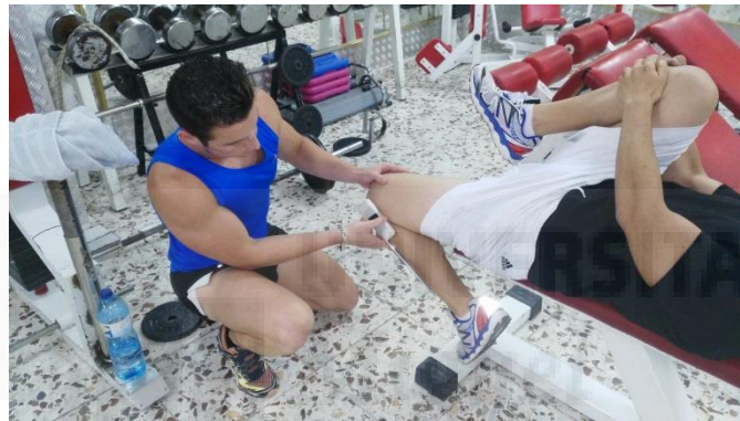
Figura 3. Test de Thomas modificado.

En cuanto a la evaluación del rango de movimiento de la musculatura del cuádriceps, se utilizó el Test de Thomas modificado (Harvey, 1998) (Figura 3). En dicha prueba el sujeto se apoya en la camilla a la altura del hueso sacro, posteriormente realiza una flexión de cadera y de rodilla (llevándola hacia el pecho) de aquel miembro inferior que no va a ser medido. El experimentador que mide, coloca el inclinómetro en el cóndilo lateral externo de la rodilla del miembro a medir, prolongando la varilla en la bisectriz de la pierna de forma que el sujeto intente una flexión máxima de la articulación de la rodilla para obtener el resultado (Harvey, 2015; Cejudo, et al. 2014).