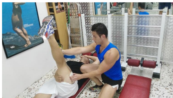
Figura 2. Test de elevación de la pierna recta.

Para la evaluación de la musculatura isquiosural se utilizó el test de la elevación de la pierna recta (EPR), como se observa en la Figura 2, que valora la flexibilidad de la musculatura isquiosural a través del ángulo de la flexión de cadera con rodilla extendida. El protocolo de medida constaba de la siguiente metodología: el sujeto se situaba en decúbito supino sobre una camilla; a continuación se colocaba el inclinómetro próximo al maléolo externo con la varilla en la línea que representa la bisectriz de la pierna; entonces el sujeto realizaba una lenta y progresiva flexión de la cadera con rodilla extendida, tomándose el valor angular de la máxima flexión que toleraba el sujeto o el momento en el cual la pelvis comenzaba a bascular en retroversión (Ayala, et al. 2013; Sölveborn, 1987; Cejudo, et al. 2014).