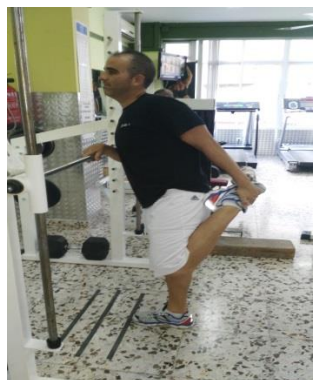
Figura 5. Estiramiento de cuádriceps.

Para el estiramiento autoadministrado del cuádriceps se utilizó un ejercicio donde el sujeto parte de una posición erguida de bipedestación con apoyo de una mano en una superficie para mantener el equilibrio. El sujeto intentó flexionar la rodilla y con la mano homolateral cogerse el pie y tirar el talón hacia las nalgas como se observa en la Figura 5 (Alter, 2004).