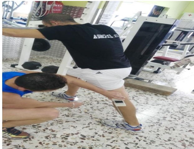
Figura 4. Test de la zancada con pierna recta.