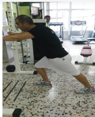
Figura 7. Estiramiento de gemelos.

Para el estiramiento del gemelo se utilizó un ejercicio donde el sujeto se colocó en bipedestación a una distancia de 4-5 pies de la pared con los brazos extendidos y apoyados en la pared, adelantar una pierna y flexionar la rodilla 90°, manteniendo la rodilla contraria totalmente extendida y con las plantas de los pies en contacto siempre con el suelo tal y como se muestra en la Figura 7 (Alter, 2004).